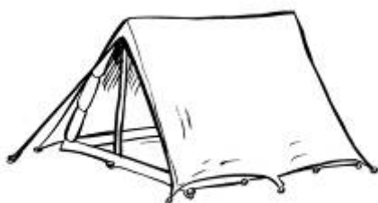
PICO DUARTE Tiendas de campaña