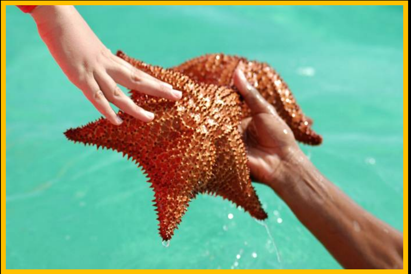
Estrella de Mar, Isla Saona (R. Dominicana).

“Si al franquear una montaña en la dirección de una estrella, el viajero se deja absorber demasiado por los problemas de la escalada, se arriesga a olvidar cual es la estrella que lo guía”.