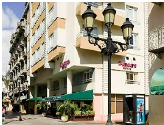
SANTO DOMINGO Hotel Mercure Comercial