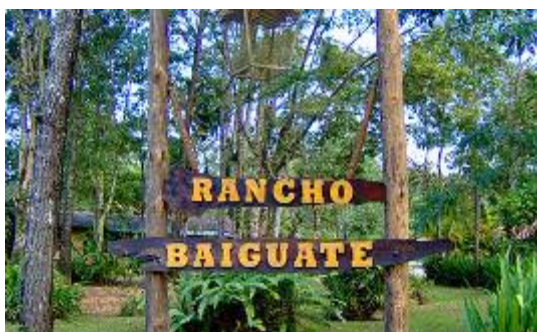
JARABACOA Rancho Baiguato