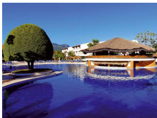
PUERTO PLATA Barceló Puerto Plata